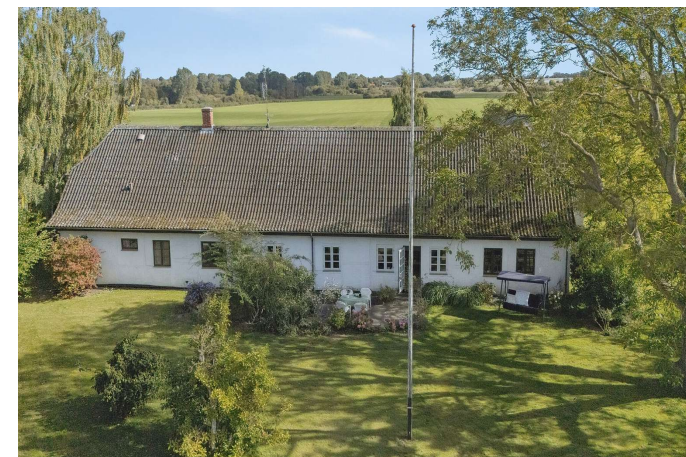
Set fra haven