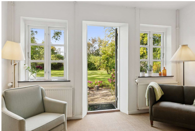
Stue med udgang til haven