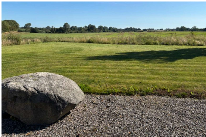
Udsigt over mose