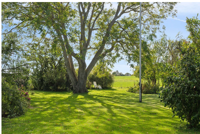
Del af den smukke have/park