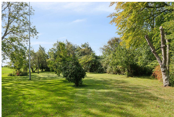
Del af den smukke have/park