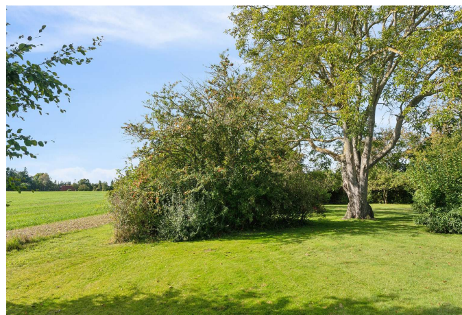
Rigelig plads til at finde læ i haven