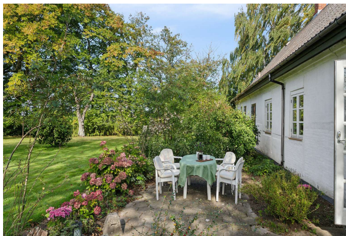
Flere dejlige steder hvor man i haven kan nyde udelivet