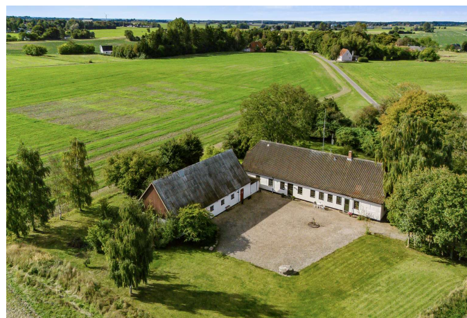
Ejendommen og smukke omgivelser