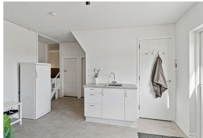
Bryggers med god plads