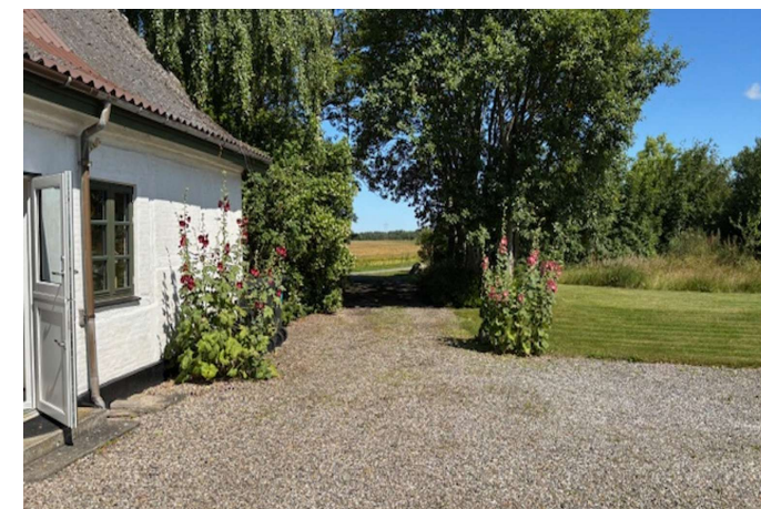
Indkørsel, se de smukke stokroser