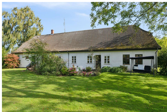
Set fra haven