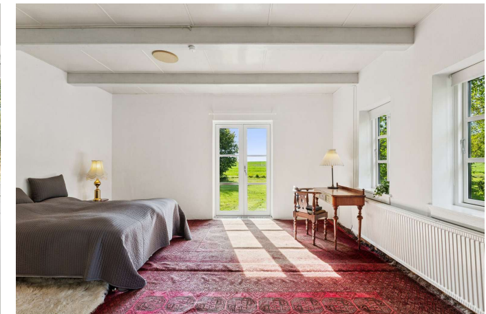
Stort værelse med udgang til haven