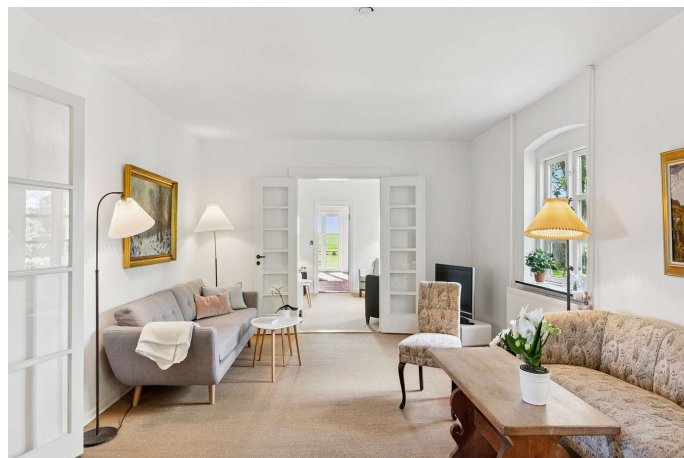
Skønne og lyse stuer