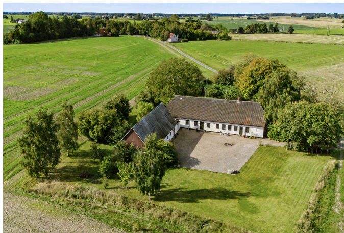
Ejendommen og de smukke omgivelser