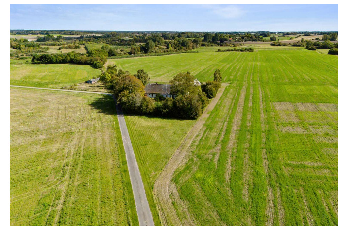
Det trekantet græsstykke foran hører med til ejd.