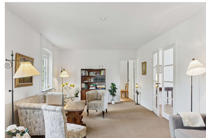
Skønne og lyse stuer