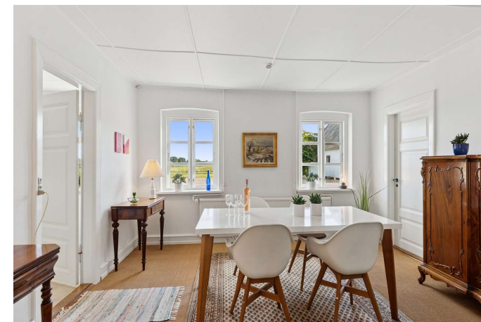
Spisestue med flot udsigt til gårdspladsen og landskabet